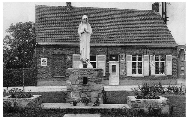
Mariabeeld aan de Snauwhoek. Het huis op de achtergrond is de huidige fietszaak Boterman.

16 Loop verder tot aan de toegangspoort van het domein. Hier eindigt de tocht.